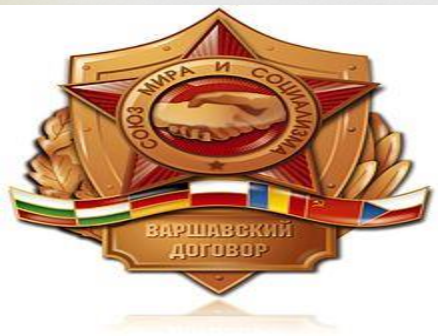
Znak Varšavskej zmluvy