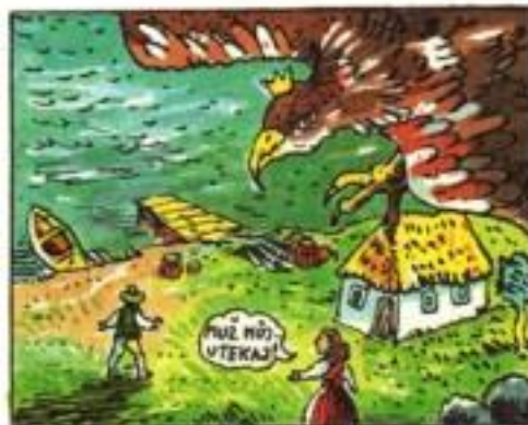
Jedného dňa sa nad jeho chalupou zjavil veľký orol.