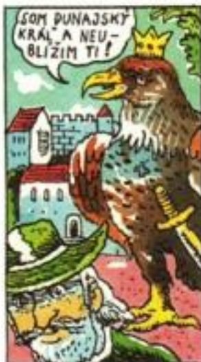
Keď rybár otvoril oči, ocitol sa na nádvorí veľkého hradu.