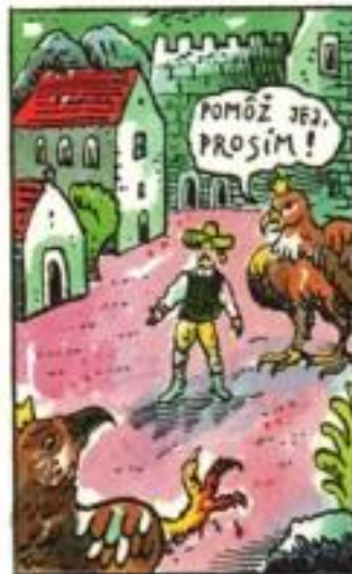
V kúte nádvorja uvidel sediť orlicu so zlomeným pazúrom.