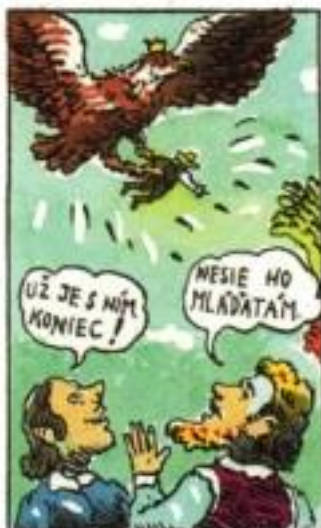
Obrovský vták schmatol rybára do pazúrov a odletel s ním preč.