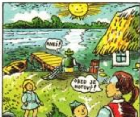
V osade na brehu Dunaja žil kedysi statočný rybár.

Medzi povestami, ktoré si kedysi rozprávali ľudia žijúci na brehu našej veľriecky, nachádza sa aj rozprávanie o dunajskom kráľovi. Jeho hrdinom je chudobný, ale statočný rybár, ktorý páňovi dunajských vôd preukázal veľkú službu.