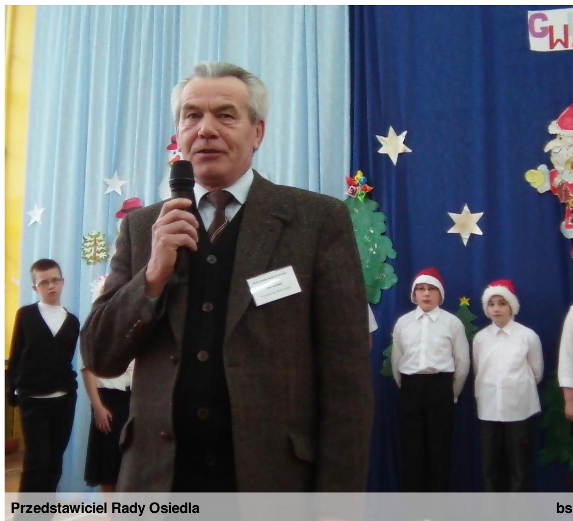
Przedstawiciel Rady Osiedla