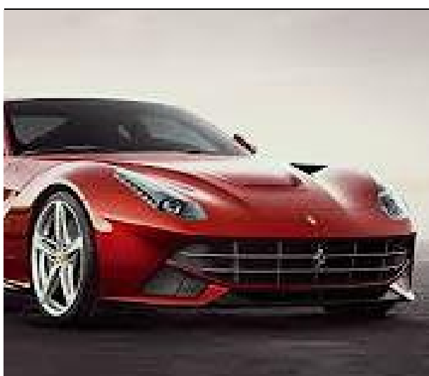
Ferrari f12 berlinetta

Magdalena Gwizdoń Maciej Kot Dawid Kubacki Zbigniew Bródka Weronika Nowakowska - Ziemniak Wszystkim zawodnikom będziemy kibicować i cieszyć się z nimi z sukcesów.